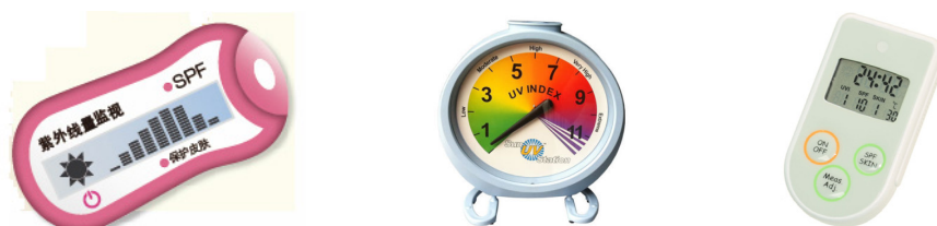
紫外日照指数（UVI）测试仪

基于其专有的紫外传感芯片制备技术，镓芯光电研发了多款紫外日照指数（UVI）测试仪，目的是让人们更好地了解阳光对人体的益处及潜在危害，适度享受阳光，拥有更健康的生活。